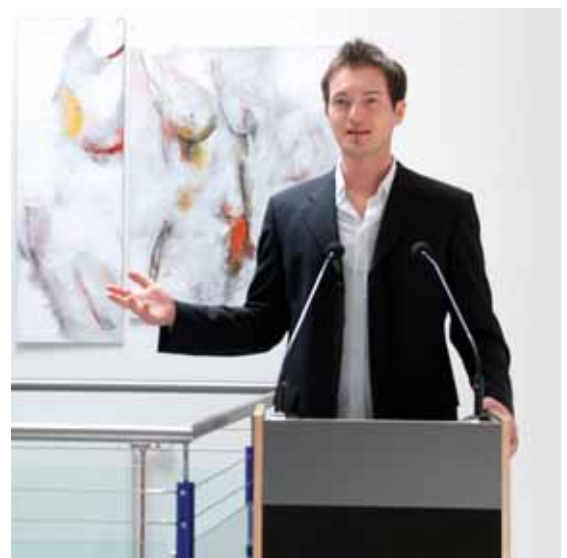
Eine Möglichkeit von vielen: Mit aufgestelltem Mikrofon wird das Multi-Media-Mobil zum Rednerpult mit eingebautem Lautsprecher.