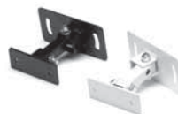
Schwenk/Neige-Halterung (Option) schwarz oder weiss