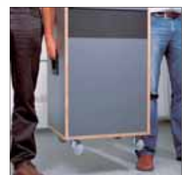
Tragbar: Stufen kein Hindernis