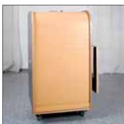
Gut geschützt: versperrbare Rolltür