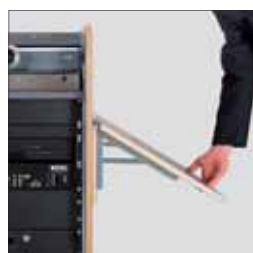
Praktisch: Klapptisch für Laptop