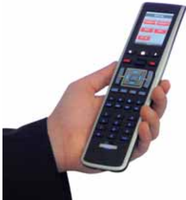
Fernbedienung in der Ladestation

Einfachste und laiensichere Bedienung mit der mobilen Funkfernbedienung. Alle Zuspielderäte, wie z.B. Video- und DVD-Player, die Anschlüsse für PC und Videokamera, die komplette Tonanlage und der leistungsstarke Datenprojektor werden mit der mobilen Funkfernbedienung am Touch-Screen bedient. Die Bedienung reduziert sich auf die wesentlichen und am häufigsten benötigten Funktionen, ist übersichtlich und selbsterklärend.