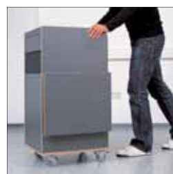
Rollend: von Raum zu Raum