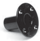
Stativflansch (Option) für die Verwendung mit Boxenstativen; Ø 36mm