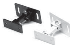
Schwenk/Neige- Halterung (Option) schwarz oder weiss