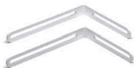
Montagewinkel lang (Option) Ermöglicht stärkeres Neigen der Tonsäule; Maße: 18,5 x 13,5 cm